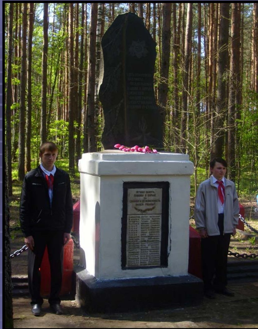
Памятник подпольщикам в д. Новая Кисловка