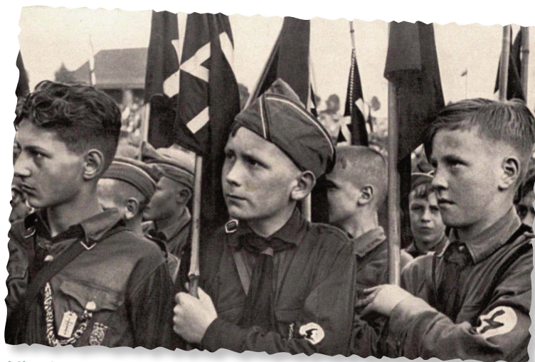
Miembros de la Juventud Hitleriana (Hitlerjugend), Alemania