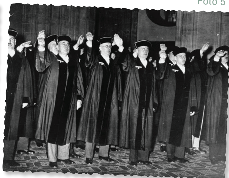
Jueces saludando a Hitler, Berlín, Alemania, 1 de octubre de 1936