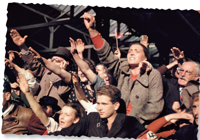
Multitud vitoreando a Hitler, Alemania, 1938