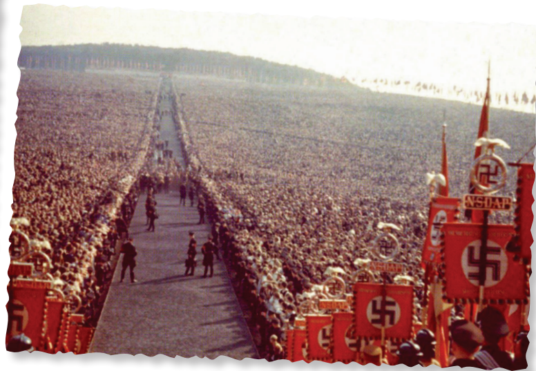
Un mitin nazi, Alemania, 1937