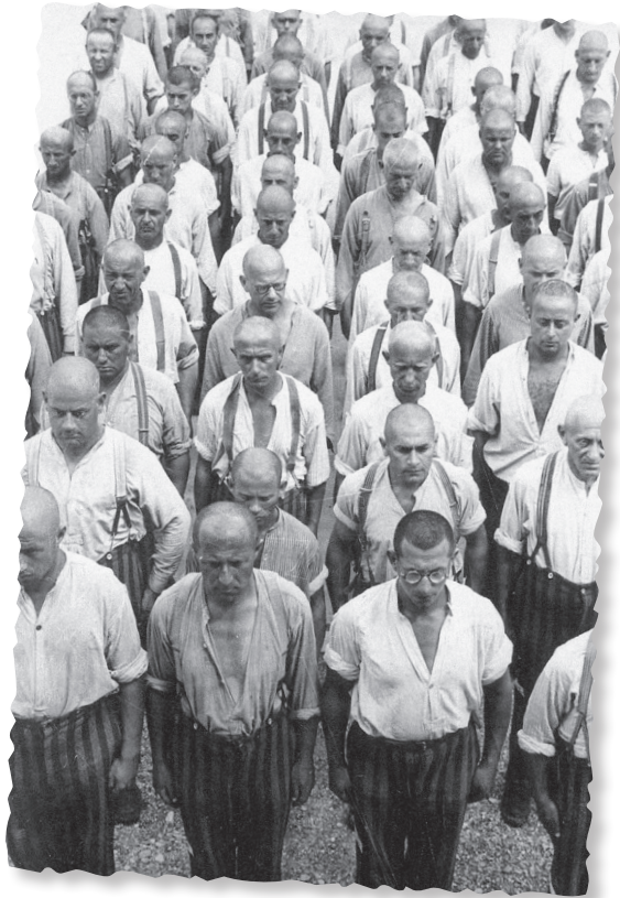
Prisioneros en el campo de concentración de Dachau, Alemania, 1938

4D09